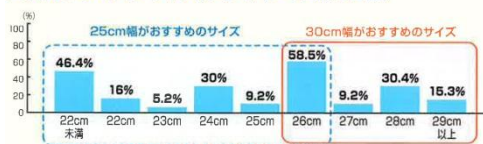
■ 保有フライパンサイズ(フライパンの上側の直径)