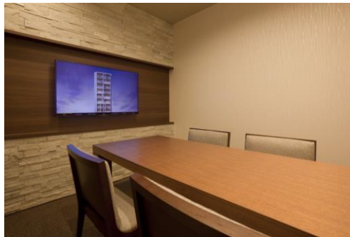
打合せコーナーやオープン会議室