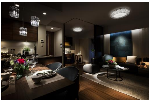
コンセプトルーム