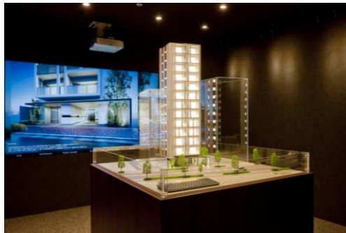
物件情報コーナー