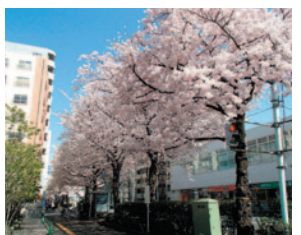
千川通りの桜並木(徒歩3分/約180m)