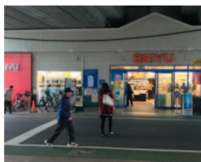
西友中村橋店(徒歩6分/約480m)