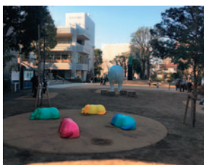
美術の森緑地(徒歩5分/約350m)