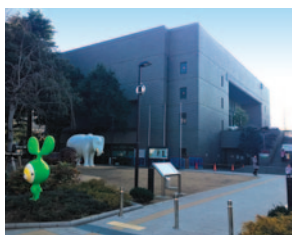
区立美術館/貫井図書館(徒歩5分/約350m)