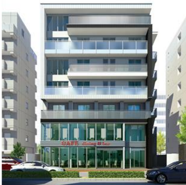
ヘーベルビルズシステムによる建物イメージパース

「ヘーベルビルズシステム」および当社の従来システムそれぞれの特徴を活かして中高層受注を強化し、2020年度には4階建て以上の受注全体で500億円を目指します。