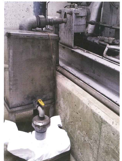
空気圧縮機のドレン排水口