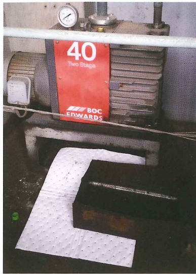
油圧機の油の入れ替え作業時