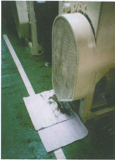
工場の床などへ流出した油の除去