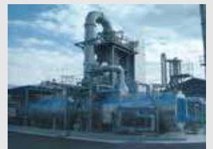
排熱回収型(横型炉)