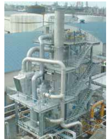
低温熱回収型高濃縮廃液燃焼分解装置 (熱交換型白煙防止)