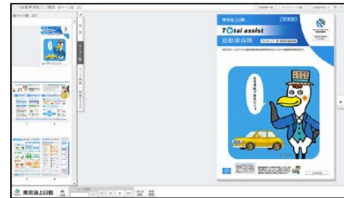
《パンフレット兼重要事項説明書イメージ》

《ご注意!!》 『同意して申込み』をクリックするま では、ご契約は成立しておりませ ん。