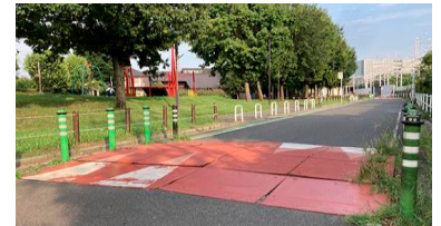
ハンプ(凸部):車の速度を落とすことを目的とし、道路上に設置されるものです。

ハンプは、車の速度を落とすことを目的に、生活道路等に設置されています。路面がなめらかに盛り上がり、30km/h以上の速度で走る車の運転者に不快感を与える構造になっています。