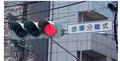
歩車分離式信号:交差点で歩行者と車の青信号のタイミングを分ける信号です。

2025年の1月に警察庁より歩車分離式信号の導入検討条件を緩和するとの通達がなされました。こどもをはじめとする歩行者の巻き込み事故の防止に効果があるとされ、通学路付近の交差点等への整備、導入が見込まれます。各都道府県警察の主導で導入の効果や影響を調査・説明の上、地域住民等からの理解も得て導入が進められます。