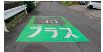
ゾーン30プラス:ゾーン30に物理的デバイスを組み合わせて交通安全の向上を図るエリアをいいます。

ゾーン30プラスは、車の最高速度を30km/hに規制するゾーン30に、物理的デバイス(狭さく、クランク等)を組み合わせたもので、歩行者優先の安心・安全な空間を作り出しています。