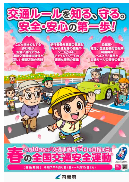
令和7年 春の全国交通安全運動ポスター

今月号では、<全国重点>①「こどもを始めとする歩行者が安全に通行できる道路交通環境の確保」を中心に、運転者の皆さまに注意していただきたい内容をお伝えします。