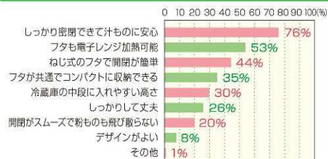
ユーザーがスクリュールック®について気に入っている点