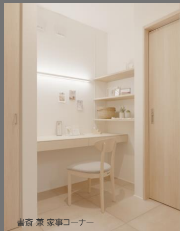
書斎 兼 家事コーナー