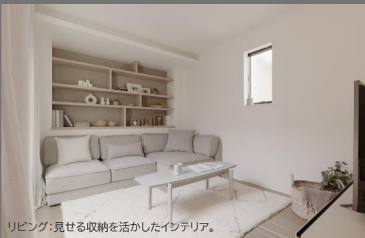
リビング：見せる収納を活かしたインテリア。