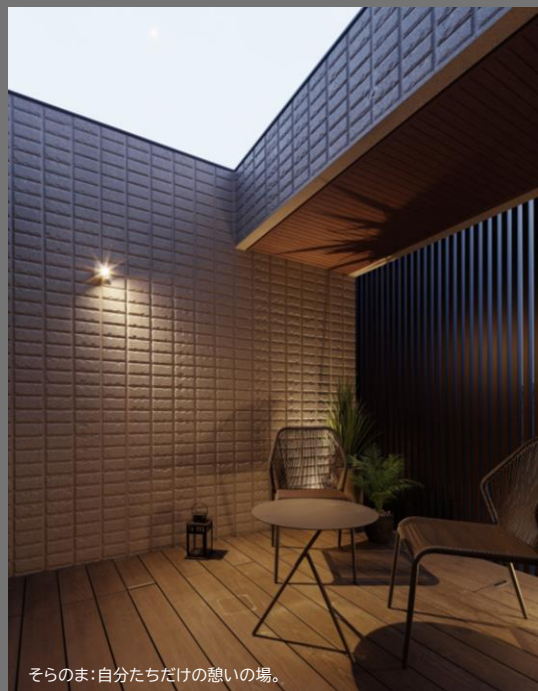
そらのま：自分たちだけの憩いの場。