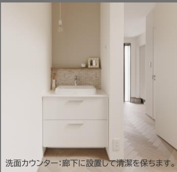
洗面カウンター：廊下に設置して清潔を保ちます。