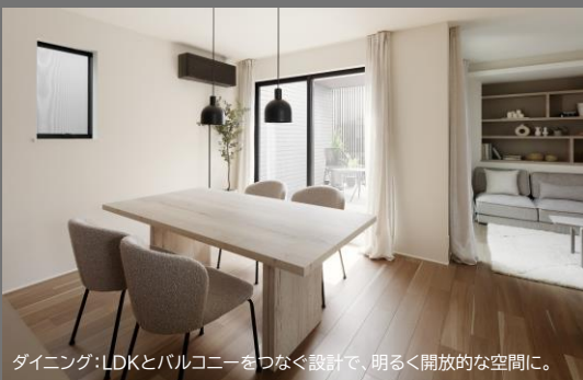
ダイニング：LDKとバルコニーをつなぐ設計で、明るく開放的な空間に。