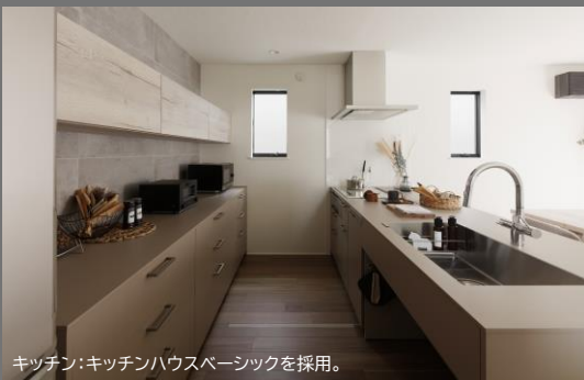
キッチン：キッチンハウスベーシックを採用。