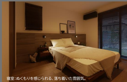
寝室：ぬくもりを感じられる、落ち着いた雰囲気。