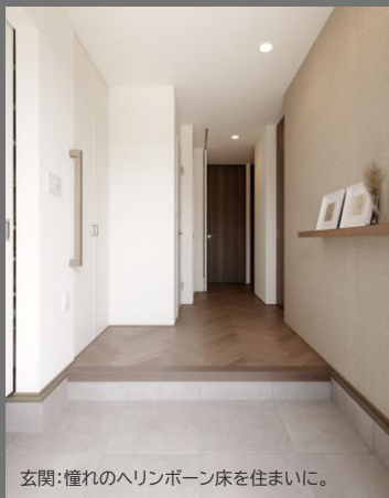
玄関：憧れのヘリンボーン床を住まいに。