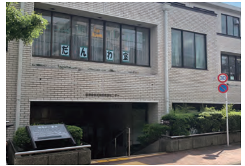
桜丘図書館 徒歩1分(70m)