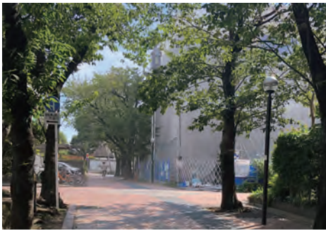
物件周辺の様子 徒歩1分(70m)