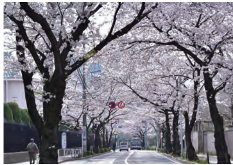
千歳通りの桜並木 徒歩3分(190m)