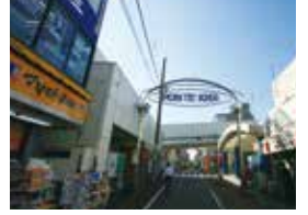
PONTE IOGI商店街 (徒歩3分/約190m)