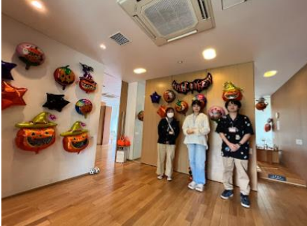
学生スタッフの皆さん

子供の参加者が楽しめるゲーム(ペットボトルボウリング、お菓子釣り)企画の立案と進行を、近隣大学の学生に実施頂きました。廃材であるペットボトルを使うことで製作コストを抑え、一方で、学生の視点で、子供たちが楽しめる企画を立案・実行することができました。