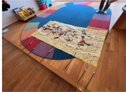
お菓子釣りゲーム