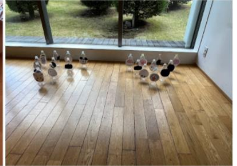
ペットボトルボウリング