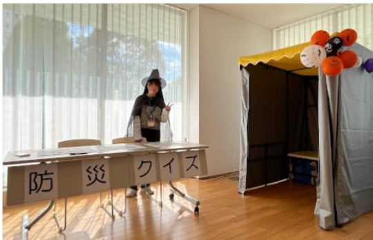
防災クイズコーナーと仮設トイレ

加賀レジデンスの共用備品として保有している仮設トイレを集会室に設置。管理会社の協力のもと、スタンプラリーに参加した子供向けの防災クイズを作成しました。クイズの運営は加賀レジデンス理事の子供達が行い、管理組合・管理会社・居住者が一体となった運営を行いました。