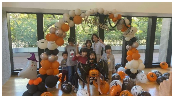
手づくりスタジオ

築3年目のアトラス加賀は、未就学児の子どもを持つファミリー世帯が多いため、アトラス加賀理事の奥様発案で、親と子供が一緒になって記念写真が撮影できるフォトスタジオを設置。アトラス加賀理事会とボランティアスタッフが当日設営を行い、多くの方から好評を得ることができました。