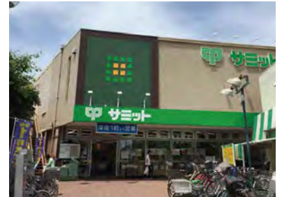
サミット ※1 (徒歩5分/約340m)