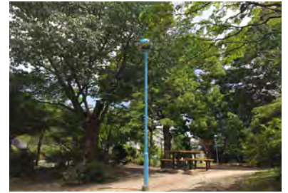
宮下橋公園 ※1 (徒歩1分/約40m)