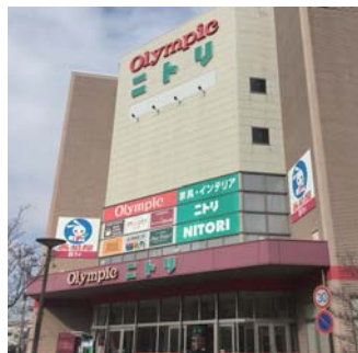
オリンピック・ニトリ(徒歩7分/約520m)