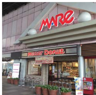
武蔵浦和マアレ(徒歩4分/約280m)