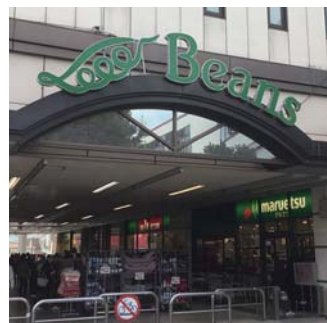
ビーンズ 武蔵浦和(徒歩6分/約480m)