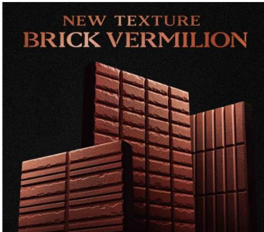
新外壁色「ブリックバーミリオン」 [ BRICK(レンガ) + VERMILION(朱色) ]

今回の新色モチーフは、時代を越えて世界中で愛され続ける「レンガ」です。これまでも大谷石・玄武岩・鉄隕石などをモチーフにした塗装シリーズがありますが、白・黒・グレーのような低彩度の色と異なり、一般的に赤系塗料色は褪色に弱いという問題がありました。独自の技術で30年耐久を叶える色褪せにくい濃い赤色と煉瓦特有の艶を抑えた風合いを実現し、街路樹や庭の木々の緑との相性にも優れた外壁色になりました。