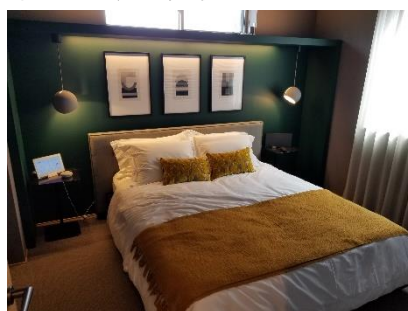
柏駅西口展示場 寝室