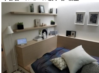
宇都宮ベルモール展示場 寝室