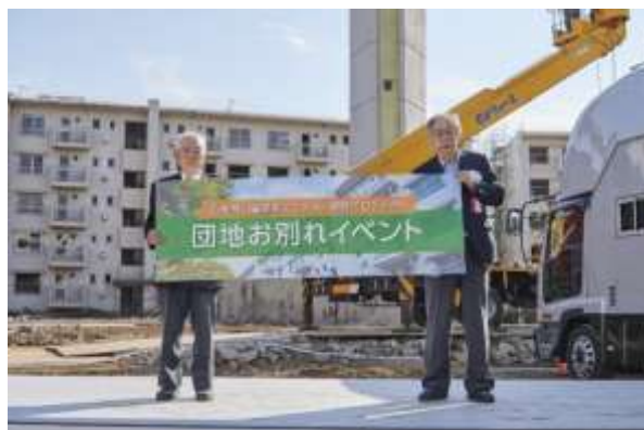
両理事長の登壇シーン