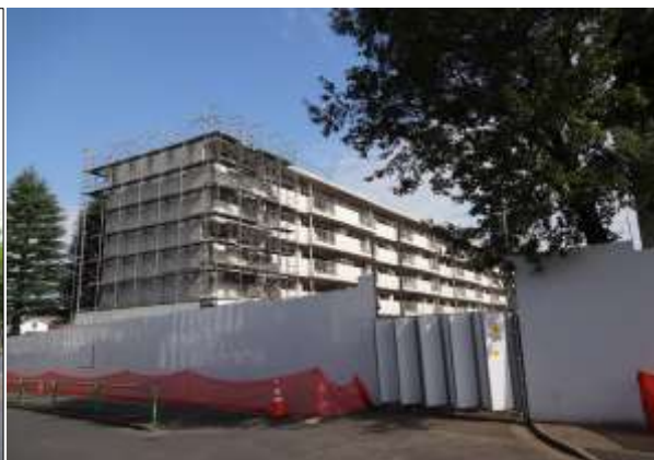
既存建物の解体準備の様子(2020年10月時点)

石神井公園団地は、1967年（昭和42年）竣工、敷地規模42,365㎡、総戸数490戸（鉄筋コンクリート造地上5階建、全9棟）の都内最大級の大型団地であり、都内では最も古い団地のひとつです。周辺は戸建住宅を中心とした閑静な住宅地が広がっており、至近には土地面積22万㎡を超える広大な石神井公園や石神井川、桜の名所である区立さくらの辻公園などの豊かな自然にも恵まれています。また、西武池袋線「石神井公園」駅、西武新宿線「上石神井」駅の2駅利用可能な交通利便性にも優れた立地です。