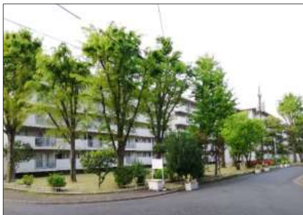
建替え前の団地内風景

なお、解体着手に伴い、住民の皆様のこれまでの様々な思いや歴史を建替え完了の2023年に繋ぐため、「団地お別れイベント」も10月27日(火)に開催されました。