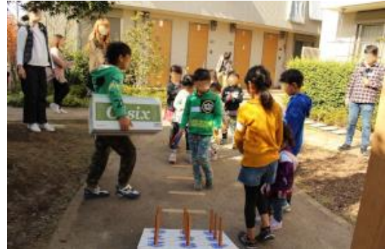
大掃除のあとのお楽しみタイム