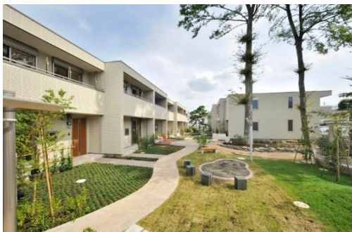
入居者のアクセス動線上に設けた「母力の庭」