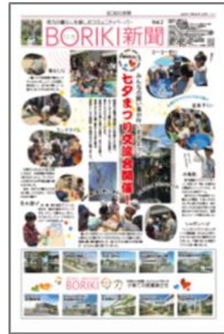
入居者参加型コミュニティ紙「BORIKI 新聞」