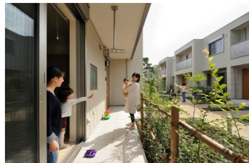
リビングと中庭が緩やかに繋がる住戸配置