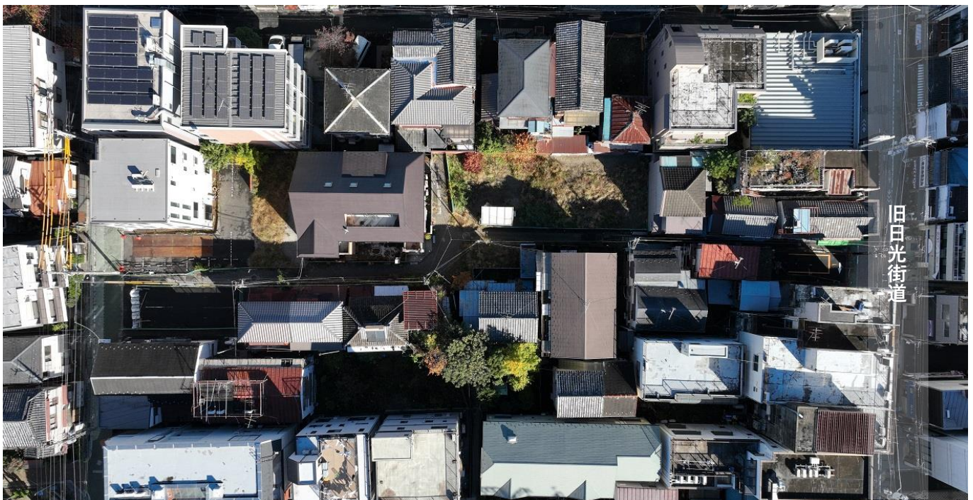
事業地区エリアを上空から俯瞰

共同化事業では、敷地を所有者が提供し、事業者と共同でマンションに建替え、その所有権を住戸に置き換える(等価交換)事業が可能です。将来の相続に備えることができる上、次世代に長く愛着を持って住み続けていただくことが可能となります。また、レジリエンス(防災)性が高く、資産価値の高い住宅へ建替えることができ、災害に強い街づくりへの貢献も実現できます。