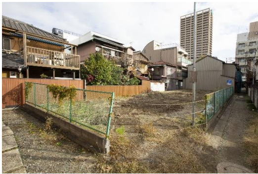
事業地区内の概況 1