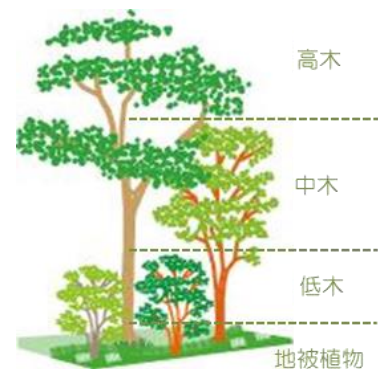
「まちもり」の基本となる植栽の階層構造

「あさひ・いのちの森」で得た植生の知見を活用し、住宅の外構計画向けに独自開発した植栽手法が「まちもり」です。高木・中木・低木・地被植物という高さの異なる階層の植栽を組み合わせることにより、そこに鳥や昆虫などの多様な生き物が集まり易くなります。そして、「まちもり」を搭載した住宅と、街中にある街路樹や公園などの緑とが繋がることで、より豊かな生態系が育まれ、地域一帯に「エコロジカル・ネットワーク」を形成していきます。旭化成ホームズグループは、「まちもり」を住宅やマンション、地域開発などの様々な事業活動に取り入れて、都市の生物多様性保全の活動を推進していきます。