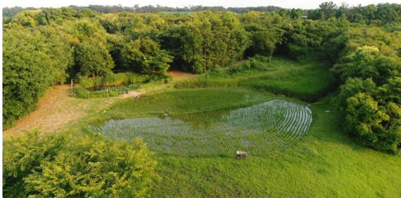
「あさひ・いのちの森」(2019 年 8 月撮影)

「あさひ・いのちの森」は、静岡県富士市の旭化成(株)富士支社内で、富士市沿岸部の原風景の再生を目指して 2007 年に開始した環境再生ゾーンです。入念な事前調査を経て、旧工場跡の完全な更地に、従業員・地域有志 1,900 人余による植樹をもってスタートしました。以降、専門家と共に綿密な緑地維持・管理計画を着実かつ継続的に実施することで、静岡県の希少植物を含む多様な動植物の定着に成功しました。