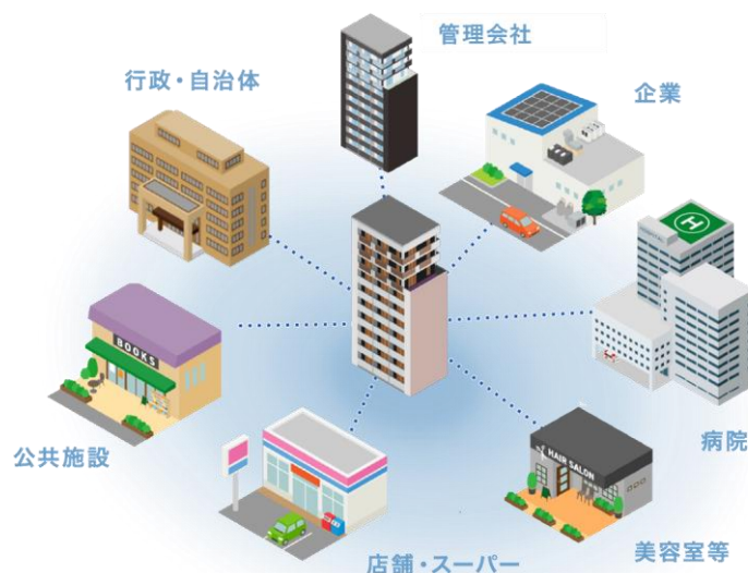
▲外部パートナー連携機能イメージ

「パートナー連携機能 ※ 」により、パートナー専用アカウント(住民向け画面の閲覧制限付)を、管理会社、周辺の自治会・商店等に付与することができます。パートナー専用アカウントからの投稿により、マンション掲示板情報、自治会の回覧板情報、お店からのお得なクーポン等を、住民がアプリからタイムリーに確認できます。この機能により、マンション住民だけの信頼空間を確保しつつ、周辺地域・商店等の活性と、住民の生活利便性向上の両輪の達成を実現します。(※特許出願中)