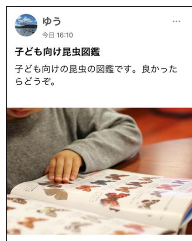
▲本のお譲り画面(利用イメージ)