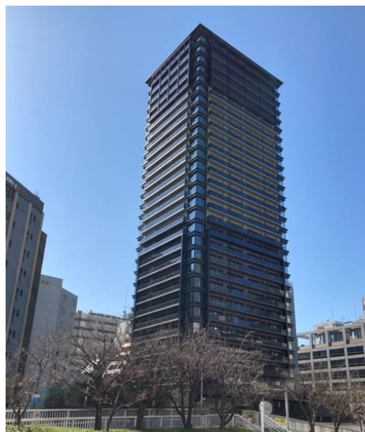
アトラスタワー五反田 外観