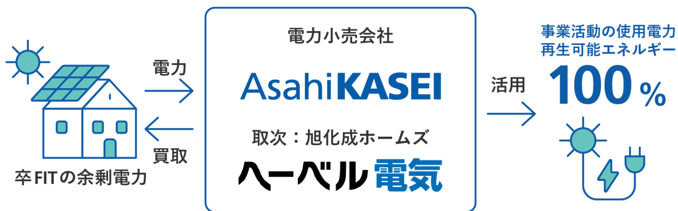
「へーベル電気」の卒FIT買取りと活用のイメージ

当社グループが設計・施工・維持管理等を行う戸建住宅「へーベルハウス」および賃貸住宅「へーベルメゾン」は、多くのオーナー様に太陽光発電設備を設置いただいております。それらの年間発電総量は「RE100」に参加した2019年9月時点で360GWh以上に達しており、それは2018年度の当社グループの事業活動で使った電力量約33GWhを優に超えていました。これらの太陽光発電設備は、国のFIT制度により設置から10年間は余剰電力の買取価格が保証されていますが、この期間を終了(=卒FIT)すると買取価格は大幅に下がります。当社の「へーベル電気」を通じて、この「卒FIT」の太陽光発電設備の余剰電力をオーナー様から買取り、「RE100」の達成に向けて活用しています。