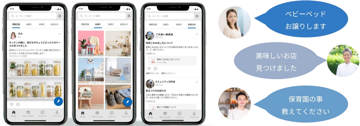
GOKINJO アプリ画面例と利用イメージ

GOKINJO を通じて、居住者様同士でマンションや子育てに関する情報交換や、サイズアウトした子供服など不用品のお譲りが可能です。居住者様専用の信頼空間、かつニックネームを利用する仕組みを提供し、ちょうど良い居住者様同士のつながりをつくります。