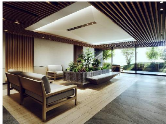
エントランスホール完成予想 CG