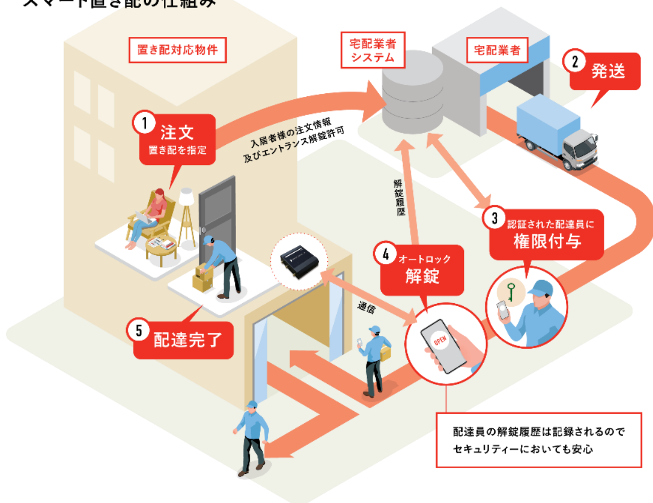
スマート置き配システム概要