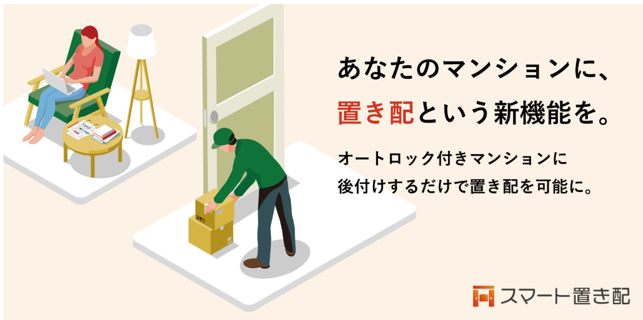
スマート置き配 イメージ図

「スマート置き配」を提供することにより、入居者様の利便性向上のみならず、再配達削減に取り組むことで、持続可能な物流を支援し、物流業界の労働環境改善や配送効率化に貢献します。