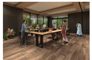
カルチャールーム完成予想図