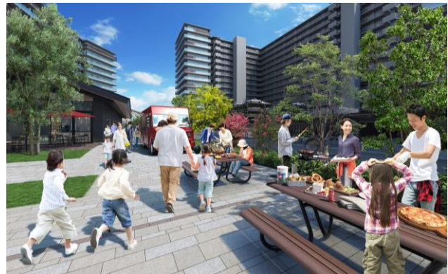
バーベキュースペース完成予想図