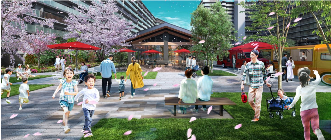
センタープラザ完成予想図