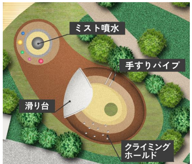
プレイグラウンド概念図