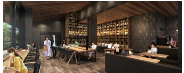
カフェラウンジ・ライブラリーラウンジ完成予想図