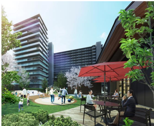
プレイグラウンド完成予想図

冒険心を刺激する手すりパイプやクライミングホールドなどを設け、足元は安心なゴムチップ素材を使ったマウントとするなど、安全に配慮しながら自由に遊べる空間を実現しました。