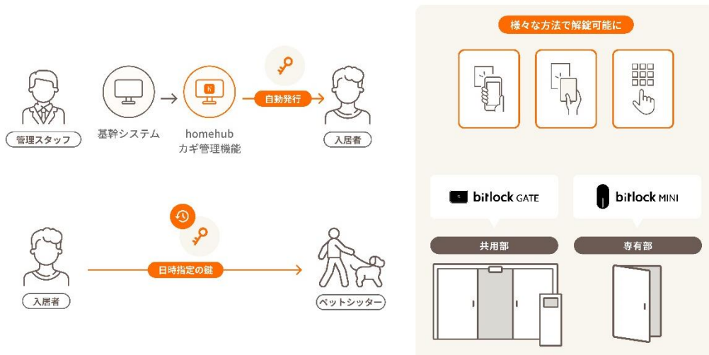
本取り組みの全体像

既存住宅のエントランスドア、各住戸ドアにスマートロックを設置します。入居時は登録されたメールアドレスへ自動で鍵の登録を案内します。入居者は「homehub」のスマホアプリから IC カードや暗証番号などの鍵情報を登録し、お好みの手段で鍵を解錠できます。入居者が希望する場合はサービス事業者に一時的な電子鍵を発行し、不在中でも置き配やペットのお世話を頼むことができます。退去時は退去日時に応じて自動的に鍵情報が削除されます。