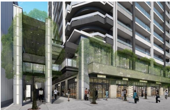
■ 東側空間イメージ (長島町通より)