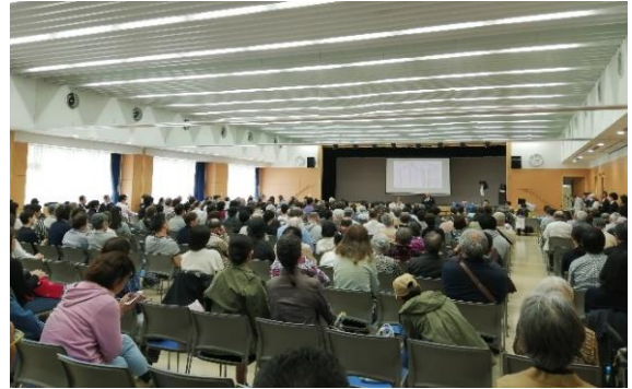
一括建替え決議 臨時総会の様子