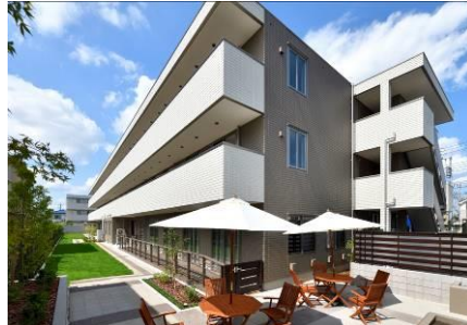
家庭菜園付き専用庭