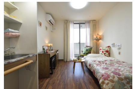
ミニキッチン付き住戸