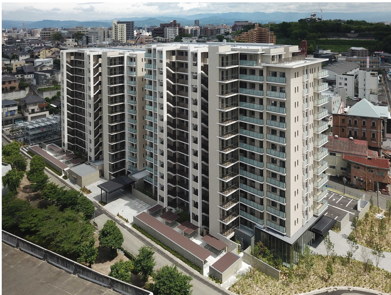
【完成後のアトラス上熊本 外観】

https://www.asahi-kasei.co.jp/j-koho/press/20180827/index.html/