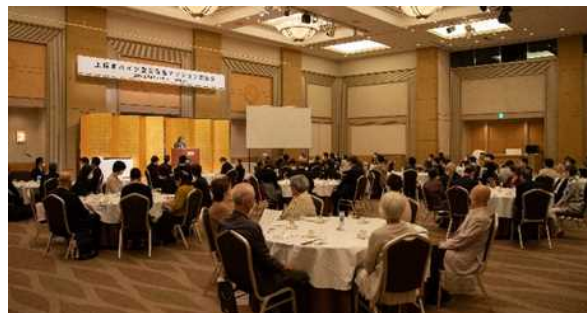
パーティー会場の様子