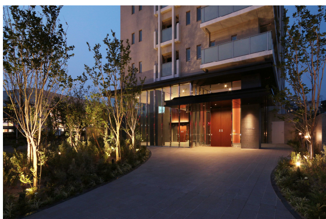
【メインエントランス】