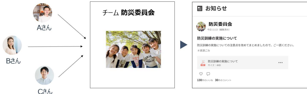
チーム方式によるお知らせ投稿

理事会や委員会、管理会社、周辺店舗等の利用を想定し、「個人」としてではなく「チーム」としての投稿を可能とする「チーム方式」を採用しています。アカウントやパスワードの使いまわしによるセキュリティリスクを低減しつつ、所属するチーム名によるお知らせ投稿を実現しました。